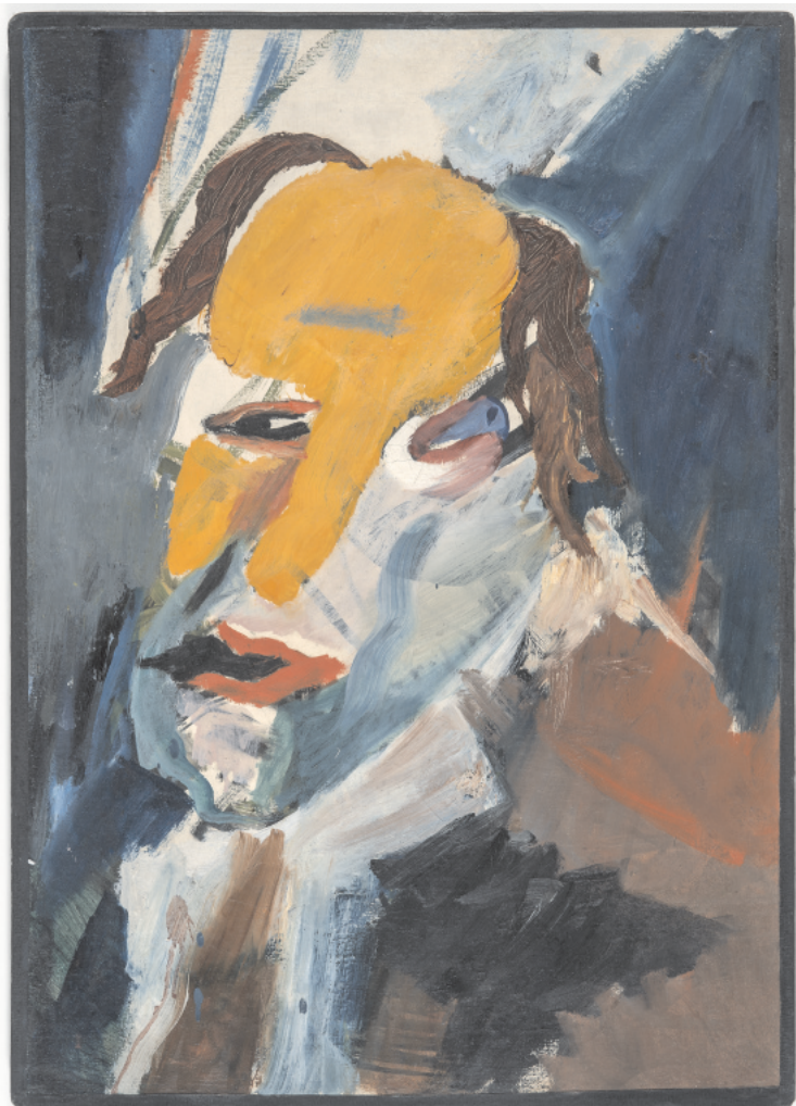
Hans Richter Visionäres Portrait. Ekstase durch Verzweiflung gefährdet, 1970. Galerie Berinson

Udstillingen fokuserer på udvalgte nedslag i kunsthistorien, hvor der kan spores inspirationer og venskab de to lande imellem, men også hvor der kan spores et fjendskab og en afstand til de kunstneriske strømninger fra Tyskland i Danmark. De 200 år udfoldes på de to museer, hvor Kunstmuseet i Tønder huser den historiske udstilling med undertitlen Før, og Kunstmuseet Brundlund Slot lægger lokaler og slotspark til udstillingens eksperimenterende samtidsdel med undertitlen Nu.