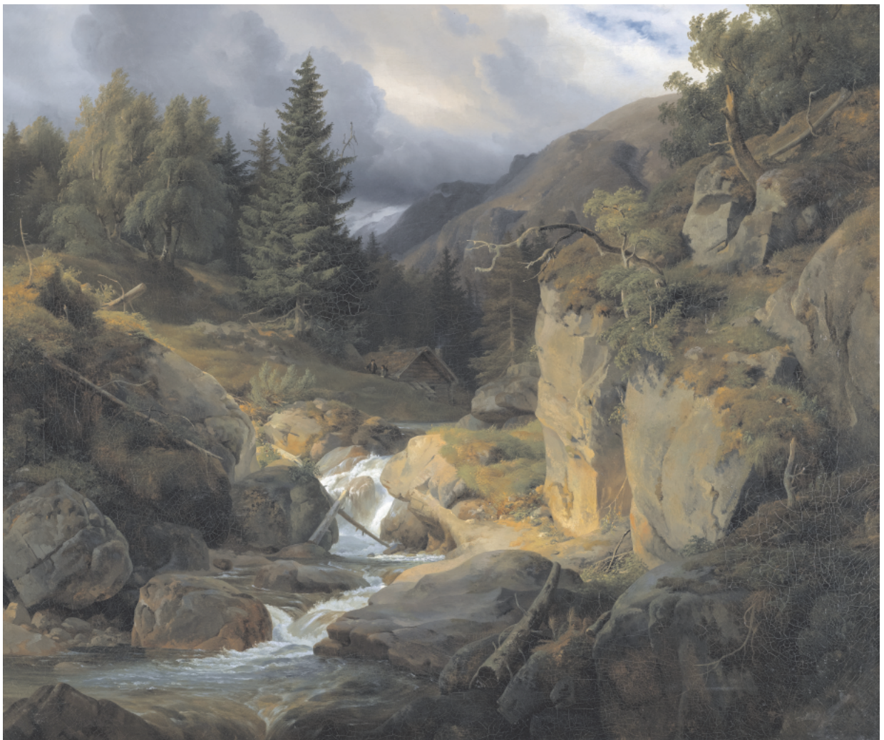
Louis Gurlitt: Norsk landskab , 1836. MSJ-Kunstmuseet Brundlund slot