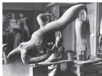
Sigurjòn Òlafsson Estate