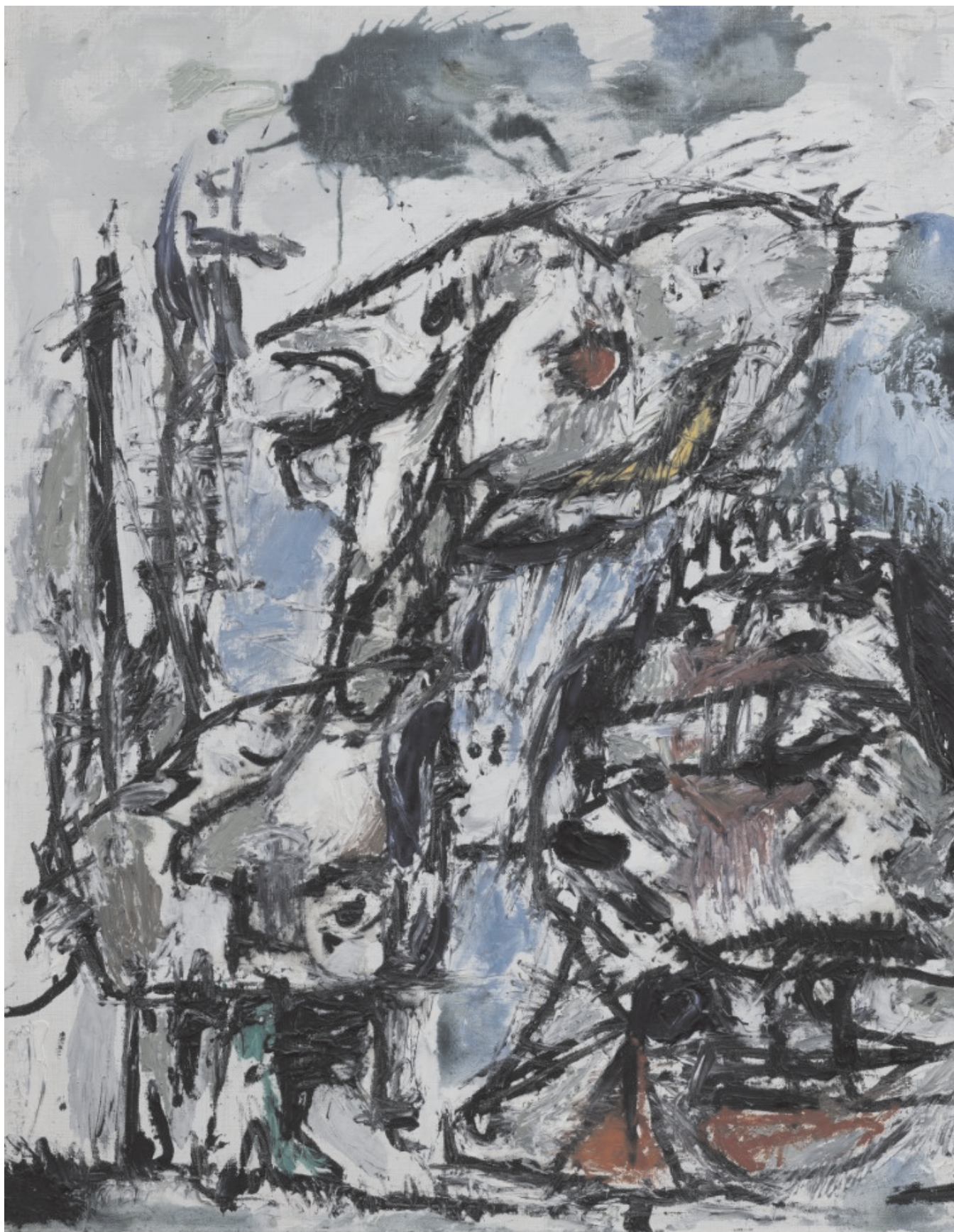
Asger Jorn: Après L'incendie , 1958. Kunstmuseet i Tønder. På udstillingen "Essens"

Medlemsbladet for Venner af Kunstmuseet i Tønder