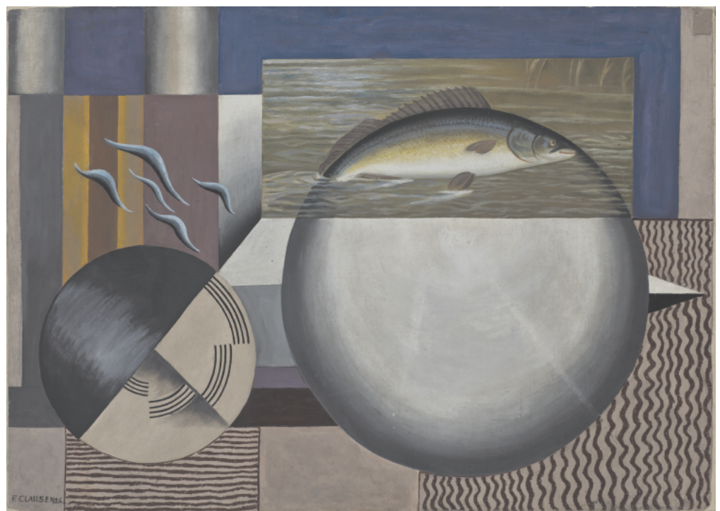
Franciska Clausen: Fisken, 1926. Olie på lærred. 64 x 89 cm. MSJ-Kunstmuseet Brundlund Slot