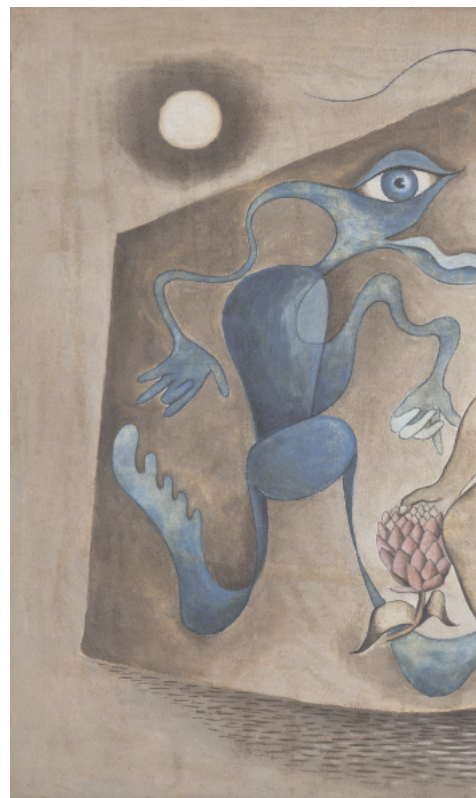
Rita Kernn-Larsen: Blåt dilemma 112 x 118 cm. MSJ-Kunstmuseet i Tønder