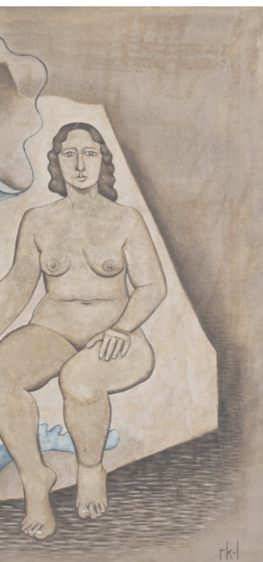
, 1935. Olie på lærred. i Tønder