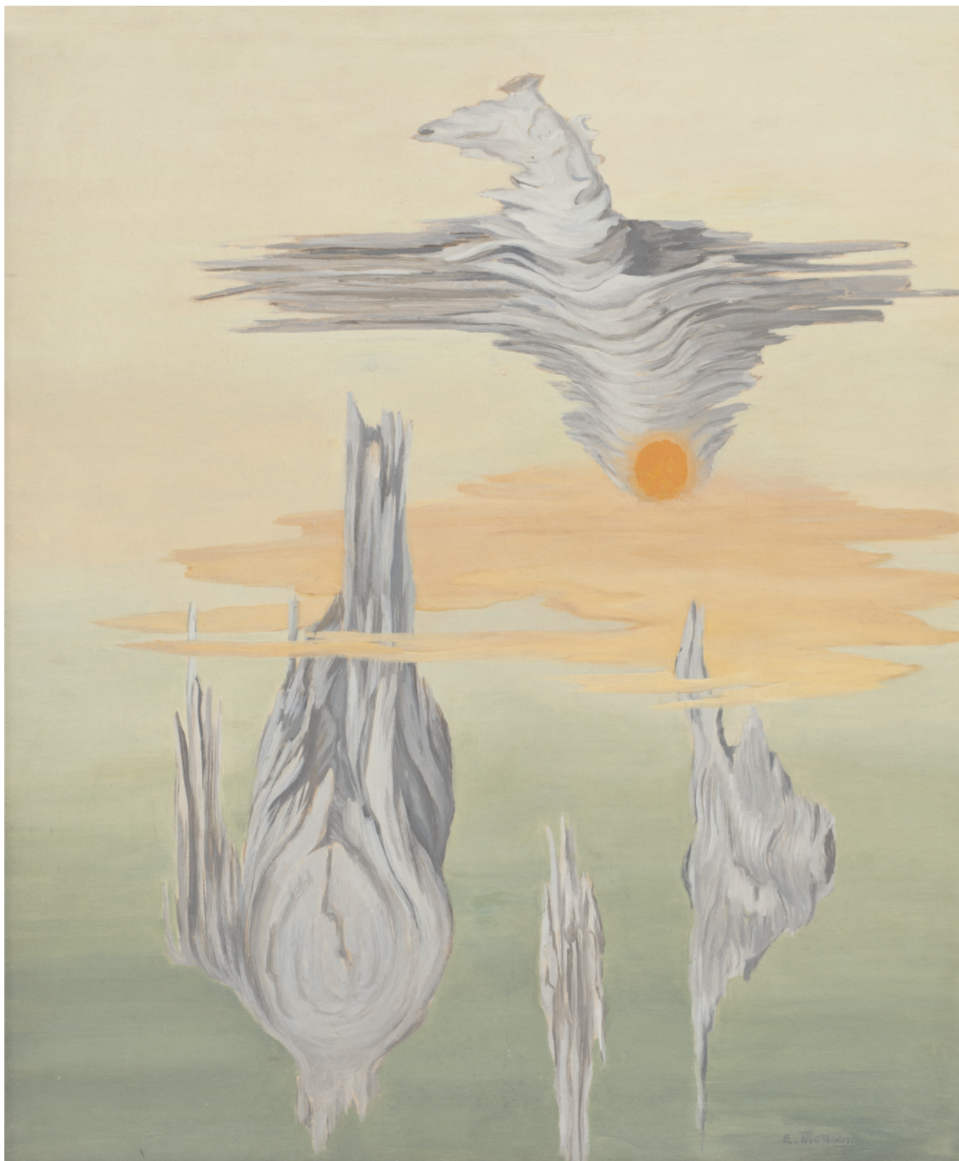
Elsa Thoresen: Objects of Elements, 1945. Olie på lærred. 55 x 46 cm. MSJ-Kunstmuseet i Tønder

Medlemsbladet for Venner af Kunstmuseet i Tønder